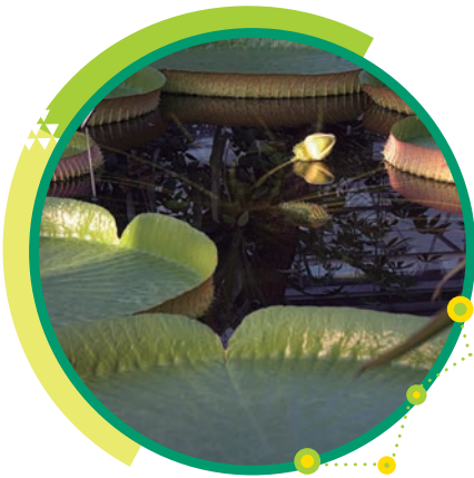
El irupé o Victoria cruziana es un planta acuática que se observa en las cuencas de los ríos Paraná y Paraguay.