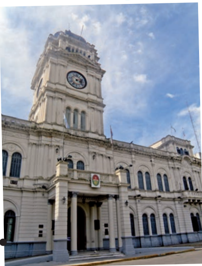
Casa de gobierno de la provincia de Entre Ríos.