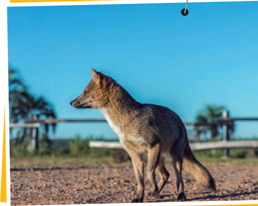
Zorro de las montañas.

Departamento: Nogoyá Superficie: 4.282 km 2 Población: 39.026 habitantes Densidad: 9,1 hab./km 2 Cabecera: Nogoyá