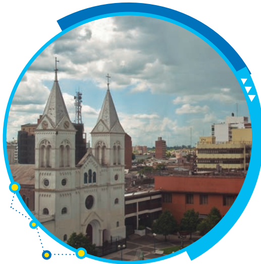
Vista de un sector céntrico de la ciudad de Concordia.

Departamento: Colón Superficie: 2.893 km 2 Población: 62.160 habitantes Densidad: 21,5 hab./km 2 Cabecera: Colón