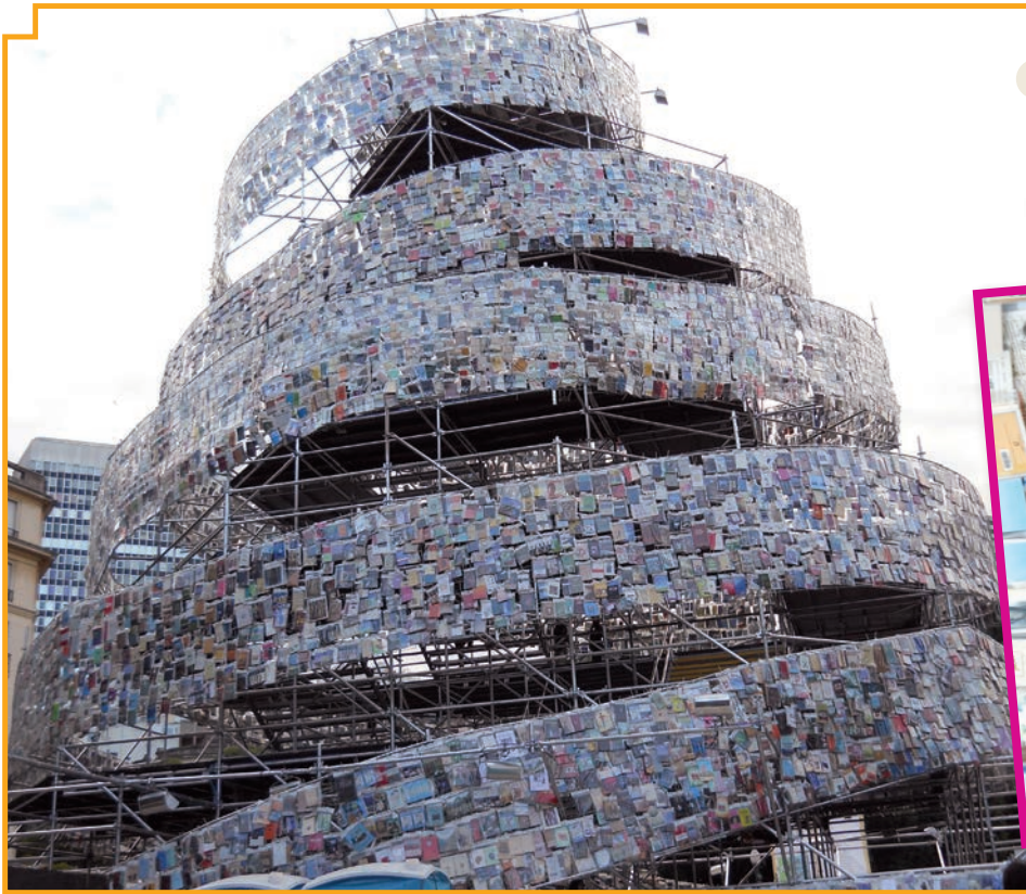
La Torre de Babel, de Marta Minujín.